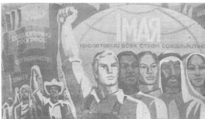
ПРОЛЕТАРИИ ВСЕХ СТРАН СОДИНЯЙТЕСЯ!