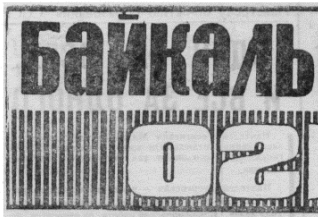
Орган Кабанского района КПСС и районного Совета народных депутатов

№ 55 (5516) ВТОРНИК, 4 мая 1982 г. Основана 17 сентября 1934 г. Цена 2 коп.