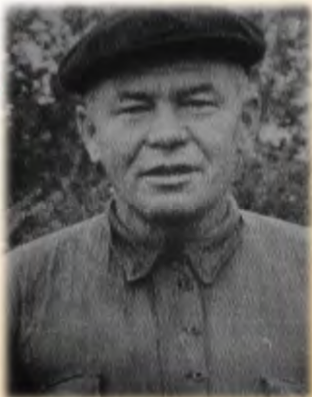
КОТОВ Гавриил Федорович