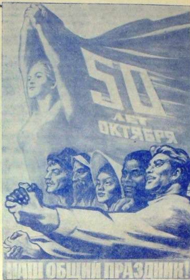
Плакат художника И. Тондзе, выпущенный издательством «Советский художник» к 50-летию Великого Октября.