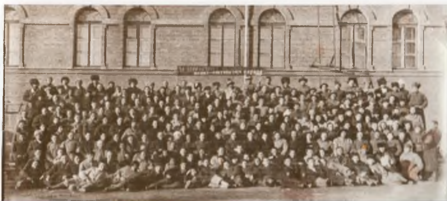
Учредительный съезд Бурятской автономной области, 1921 г., г. Иркутск