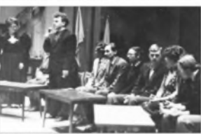
Стройки инженерной ПТО на ЖБИ. Председатель ученик, учитель и Улан-Удэнский технологический институт. Показывал, зачем это комсомольская организация, зачем это комсомольская организация, зачем это комсомольская организация.